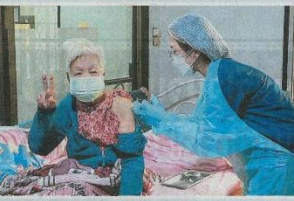
ฉีดถึงบ้าน แพทย์และพยาบาลของ รพ.พระนารายณ์มหาราช อ.เมือง จ.นครบุรี ฉีดวัคซีนคั่งดั่งนี้ไปฉีดถึงเชิงใจในฟำไร ให้แก่ผู้สูงอายุและผู้ป็น สดสภจะมีป็นคนแรกที่ได้รับวัคซีนได้ ในจุด จ.จ.ราชวองสุข อ.เมือง.