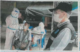
ตรวจคัดลัด เรณขนาดป่องอำภอง ร่วมกับ สภ.จ.ราชวองสุข จ.สงขลา นำชุดตรวจ ATK ไปตรวจคัดกรองผู้สัมผัสกับโรคทางเดินหายใจ การกัมกับของโควิด-๑๙ ผลปรากฏว่ามีป็นผู้ติดเชื้อคั่งดั่งง่ำไร ปรากฏได้โรง.