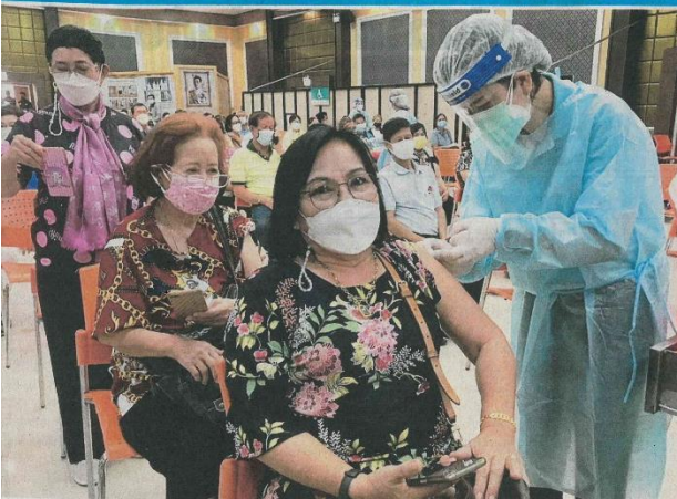
ฉีดโมเดอร์นา พ.ศุ โศภมา ธรรมรักษ์ กท. ราชเจ้าพระยาอภัยภูธร ๑.เมือง จ.ปราจีนบุรี เริ่มรวมประชาชนที่ได้รับวัคซีนครบ ๒ เข็ม มาเข้ารับการฉีดเข็ม 3 และโมเดอร์นา เข็มที่ ๓ ปรากฏว่ามีประชาชนให้ความสนใจไม่จำกัดในการฉีดวัคซีน เพื่อสร้างภูมิคุ้มกันป้องกันโควิด-19 กันอย่างคึกคัก ด้มตามคำสั่ง ซึ่งปะจวบจุฬการบริหารกัมกับจังหวัดปราจีนบุรี