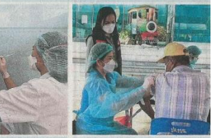
ได้ฉีดแล้ว ผู้สูงอายุใช้ใช้รับการฉีดวัคซีนไฟเซอร์ที่ศูนย์ฉีดวัคซีนโควิด-๑๙ที่สถาบันบำราศนราดูร กรมควบคุมโรค จ.นนทบุรี ด้วยความตั้งใจ.